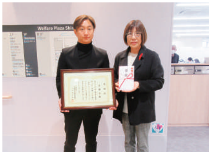
R8.1.15 木曜会 様