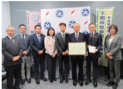
R7.12.12 (公社)下関法人会 様