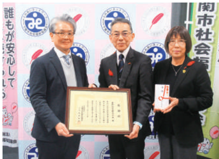
R7.12.26 建和住宅(株) 様