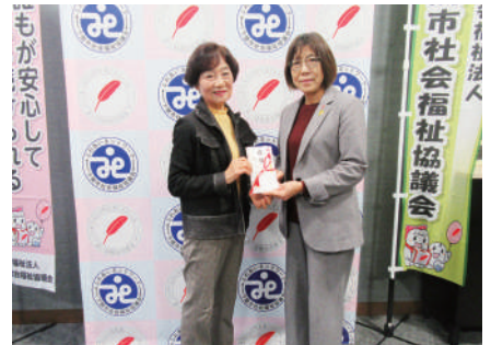
R7.12.22 健美体操 幡生教室・長府教室 様