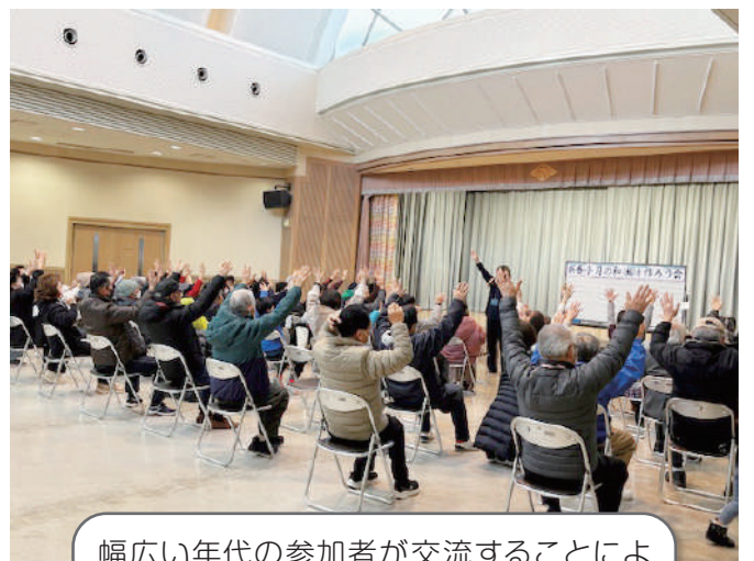
幅広い年代の参加者が交流することにより地域の活性化を促進し、地域の見守りを維持することを目的に「新春小月の輪(和)を作ろう会」を開催しました。2歳から80代まで70人が参加し、ゲームを中心に楽しい時間を過ごしました。