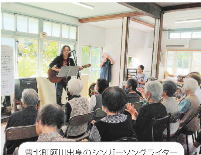
豊北町阿川出身のシンガーソングライター大塚直之氏をお招きして「阿鼓の郷 ふれあいライブ」を開催しました。地元の言葉でつくられた歌やトークに、参加者は昔を懐かしみながら和やかに過ごされ、地域の“出会い・ふれあい・交流”の機会となりました。特定非営利活動法人 阿鼓の郷(豊北町阿川地区)