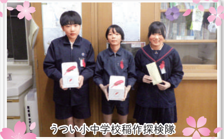
うつい小中学校稲作探検隊