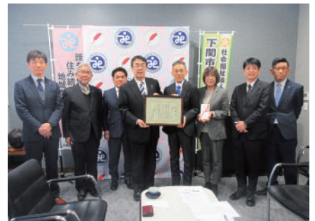
R8.1.26 下関北ロータリークラブ 様