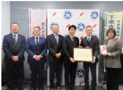
R7.12.19 (一社)山口県中小企業家同友会下関支部 様