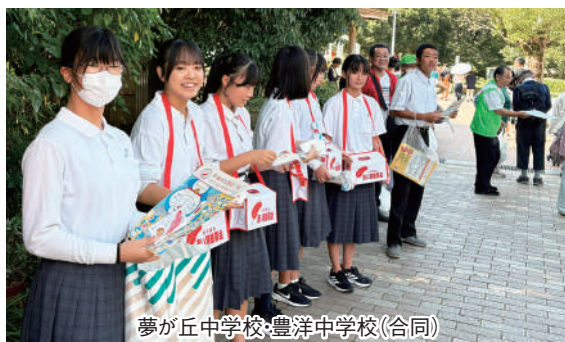
夢が丘中学校・豊洋中学校(合同)

豊浦コスモスまつりの会場で夢が丘中学校・豊洋中学校の学生ボランティア達と募金活動を行いました。