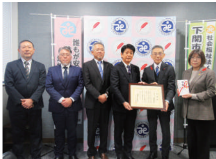
R7.12.19 (一社)山口県中小企業家同友会下関支部 様