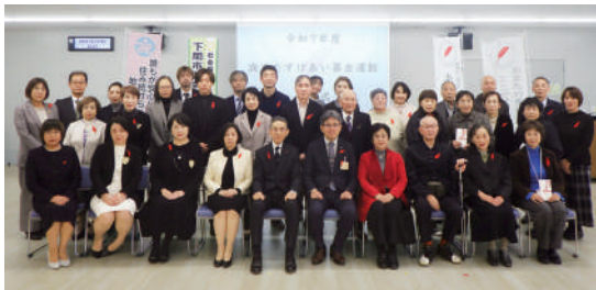
歳末たすけあい募金運動贈呈式