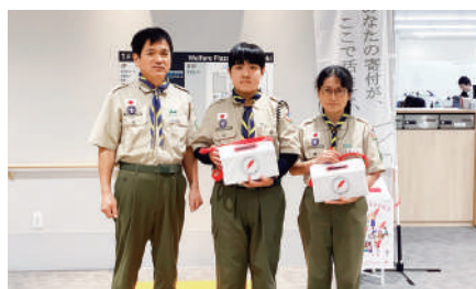
ボーイスカウト下関第11団様