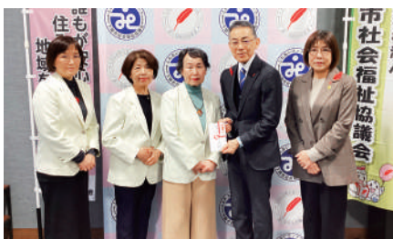
下関商工会議所女性会様