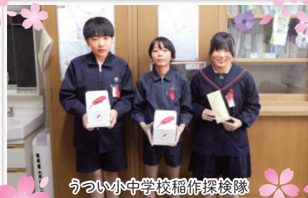
うつい小中学校稲作探検隊