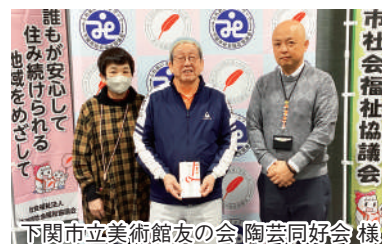
下関市立美術館友の会 陶芸同好会様