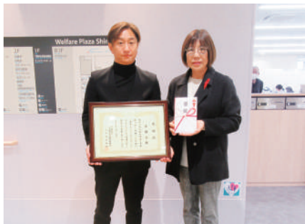
R8.1.15 木曜会 様