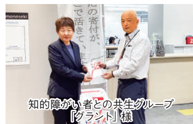
知的障がい者との共生グループ「グラント」様