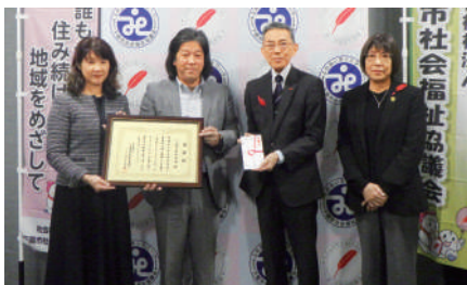
下関市保育連盟様