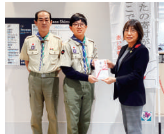
ボーイスカウト下関第7団様

「赤い羽根共同募金・歳末たすけあい募金」に関するお問い合わせは ▶ 下関市共同募金委員会まで ☎232-2002