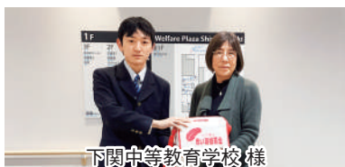
下関中等教育学校様