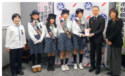
ガールスカウト山口県第30団様